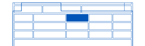
Haus A Westfassade